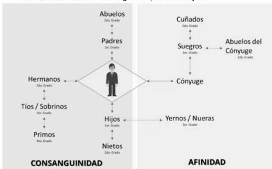
Ilustración 3. Parientes Consanguíneos por afinidad y civil

En la Ilustración 3, se presentan los vínculos que pueden constituirse en conflicto de interés en el momento en que se gestione, celebre o participe en operaciones donde intervengan las siguientes personas de conformidad con sus vínculos: