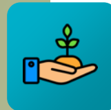
Canal de Recepción

Las quejas y reclamos de la entidad se reciben y tramitan a través del aplicativo web SPQR conectado con la Superintendencia Financiera de Colombia a través de Smart supervisión. Estas, tuvieron un tiempo promedio de respuesta de 0 días hábiles .