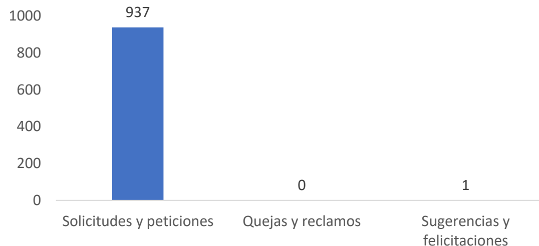
Relación de peticiones

Como la entidad financiera de desarrollo del sector agropecuario y rural colombiano, estamos comprometidos con la calidad del servicio a los consumidores financieros, generando un ambiente propicio y atendiendo de manera oportuna las solicitudes, peticiones, quejas y reclamos SPQR radicados a través de los canales dispuestos por la entidad para ello.